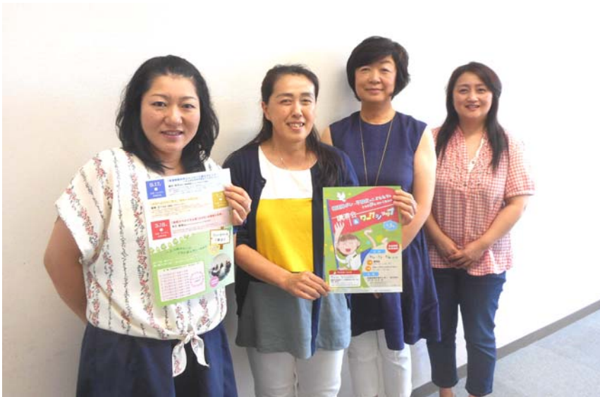
▲森さん：左から2番目