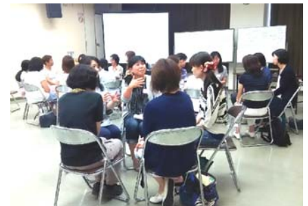
▲ グループディスカッションの様子