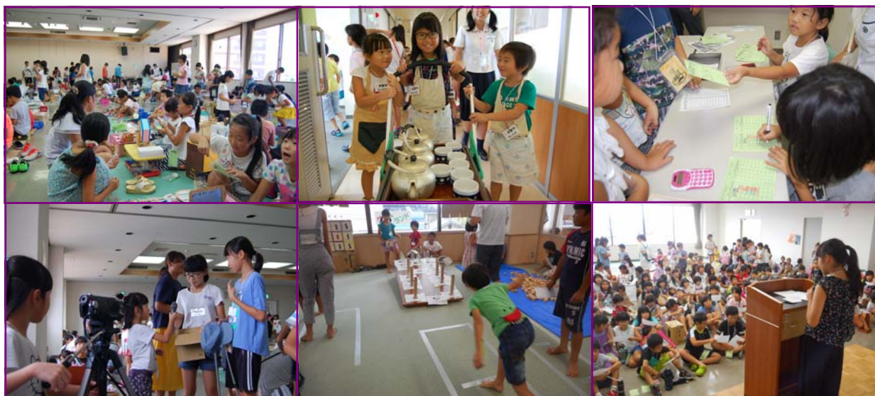
▲ 昨年のなごみん横丁の様子。みんなすごく楽しそうでした。