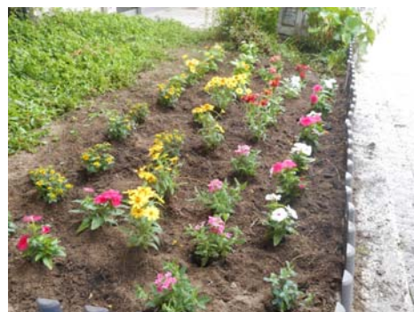
▲ 植え替え後の様子