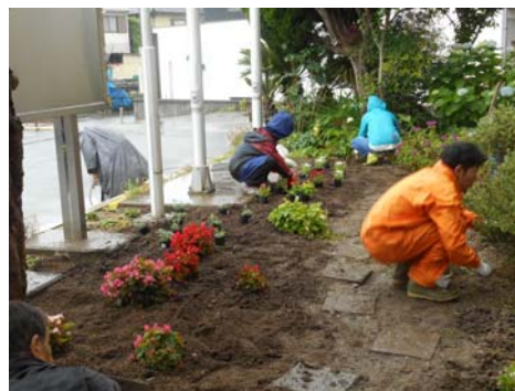
▲ 植え替え作業の様子