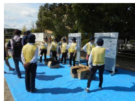
▲ 屋外では段ボールで作った簡易トイレの展示と作り方をレクチャー