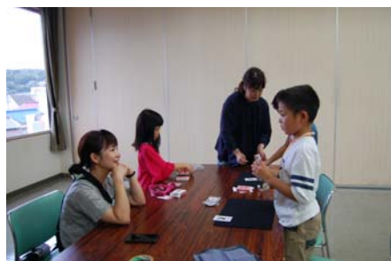
▲ マジックをお母さんに披露