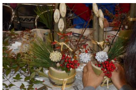
▲ 完成した門松 ▼ 縄の縛り方が重要