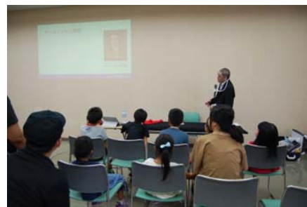
▲ マジックの基本講習