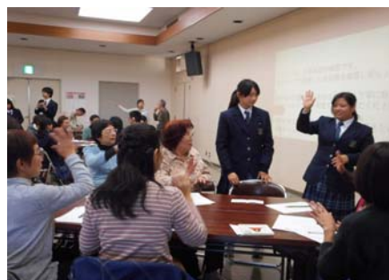
▲ 昨年の手話講座の様子