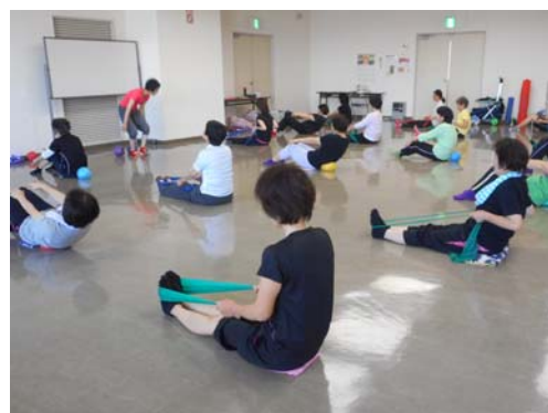
▼ 器具を使った筋力アップ