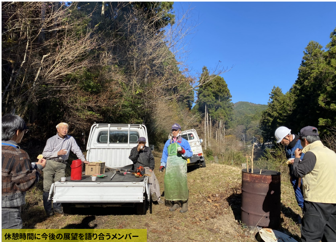
休憩時間に今後の展望を語り合うメンバー