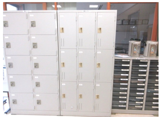
▲貸しロッカーとメールBOX(よりなん)