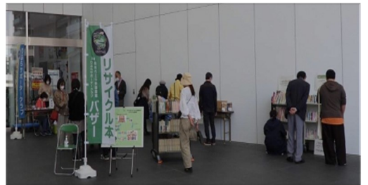
▲図書館リサイクル本バザー

ボランティア活動では“自分自身が楽しむこと”が長続きの秘訣。皆さんも、ボランティアを探す時の参考にしてみてくださいはいかがでしょうか。