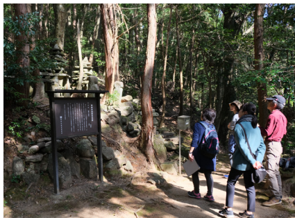
↑ 謎は謎のまま? 切越八面塔 (切越町)