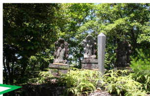
しんたけさん 新嶽山(榎山町・夏山町)