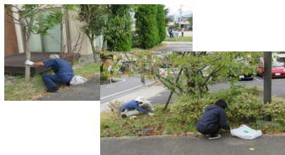
駐車場の草刈り作業の様子

「上地八区町内にあり、いつも利用させてもらっているよりなんをきれいにしたい」と総代さん始め多くの町民の方々が協力していただきました。ありがとうございます。