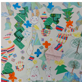
▲アート体験での作品

メニュー表の中から好きな料理を一品ずつ注文していくアラカルトのように、個性あふれる作品や作家との出会いによって、関わってくださる皆さんが笑顔になることを願ってつけました。アート体験や交流会を開催しています。お気軽にお問い合わせください。