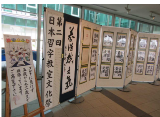
▲過去の展示のようす (日本習字)

※初日と最終日は準備・撤去をしている場合がございます。 作品展示団体を募集しています。詳細はやはぎかんまで。