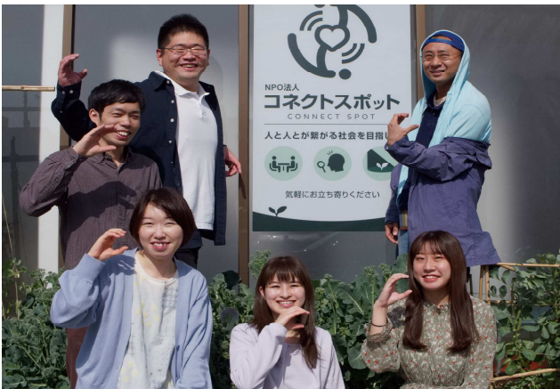
▲スタッフの皆さん

岡崎市市民活動団体の中から毎回1団体の活動について紹介しています。活動への参加などにご利用ください。