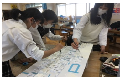
▲立体模型を制作している様子

明治5年に当時の誓願寺の住職が寺と町を活気づけるために始めたおまつりです。昭和40年代以降、「花のとう」に合わせて矢作商店街振興組合が春の商業まつりを行うようになりました。20年ほど前からは岡崎城西高校が協力するようになり、誓願寺・矢作商店会・岡崎城西高校・愛知学泉大学・学泉短期大学が実行委員会を結成し、まつりを盛り上げてきました。しかし2020年からは新型コロナの感染拡大の影響で開催が中止されています。