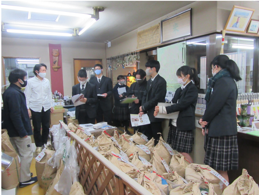
▲渡辺米穀店での取材の様子。お米の種類の多さにビックリ！