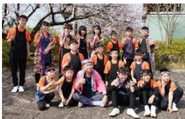
▲第18回岡崎桜まつり太鼓フェスティバル