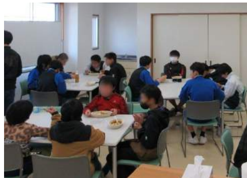
▲楽しそうに語りながら カレーライスを味わう子どもたち

2024年3月には、子ども食堂の形をとった居場所を悠紀の里に一時的に設け、80食のカレーライスが提供されました(中学生以下無料)。一緒にカレーを食べるほかにも、思い思いに交流を楽しむ小中学生の姿がありました。これからも何らかの形で子どもたちの居場所作りを継続していきたいと意欲をみせています。