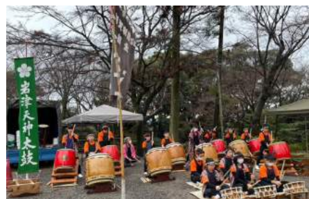
▲岩津天満宮初天神祭

岩津天神太鼓 遊は、岡崎市で唯一の子どもだけの太鼓打ちチームです。和太鼓の演奏で地域のイベントを盛り上げたり福祉施設を慰問したりしています。また、技術の向上やチームワークを高める練習を通して子どもの心身の健全な育成を目指しています。