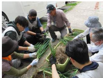
▲ボランティアとの活動の様子 (おひさまガーデン)

よりなん館内に季節の飾りを一緒に作っていただけるボランティアを募集しています。気軽にできるボランティアとしてとても人気が、昨年度は延べ1,018人の皆さんと活動しました。今年度も皆さんの参加をお待ちしています。