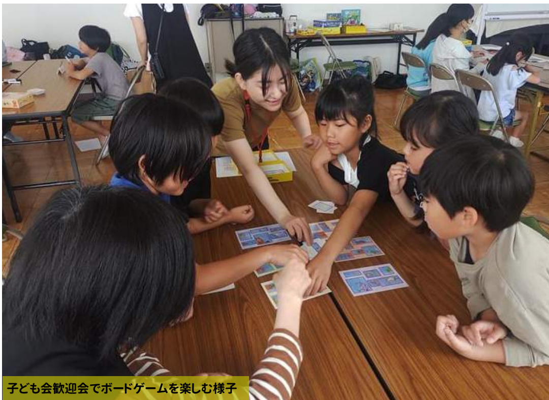
子ども会歓迎会でボードゲームを楽しむ様子