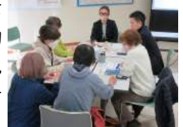
▲2024年12月のふりかえりのようす

よりなんの市民活動サポート研修では、イベント運営力を強化する研修を開催しました。1回目ではイベントを主催するうえでの留意点等を伝え、2回目までの間に受講団体には実際にイベントを開催していただきました。受講団体からは今回の研修を通じて気づいたことを今後の活動に活かしたいと前向きな姿勢が見られました。来年度も市民活動サポート研修を開催予定です。ぜひ、ご参加ください!