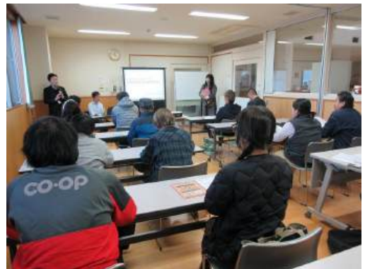
▲事前登録説明会のようす