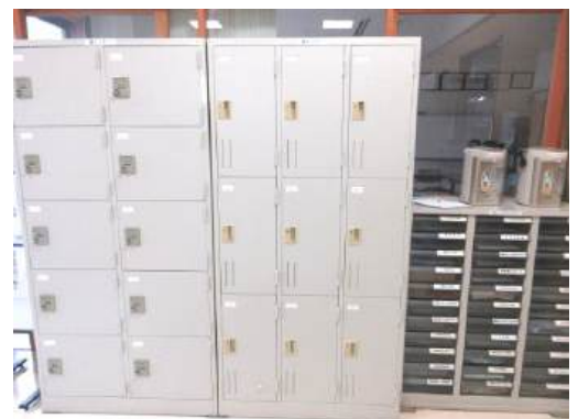
▲貸しロッカーとメールBOX(よりなん) 仕様については各センターへご確認ください。