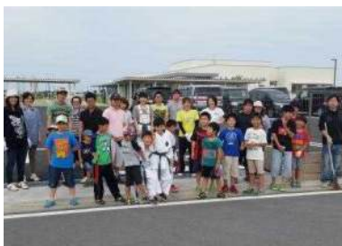
▲皆と一緒に清掃活動!