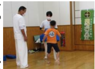
←ゆきファミリーパークにて

具体的には、思いやりと優しい心に満ちた、いじめの無い社会づくりに貢献し、多くの人に空手道を知ってもらおう活動をしています。多くの人に空手道に触れてもらうため、体験会を定期的開催しています。初心者でも安心して参加できるよう、丁寧に指導しています。