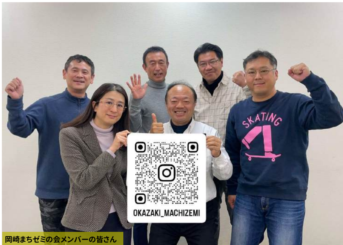
岡崎まちゼミの会メンバーの皆さん