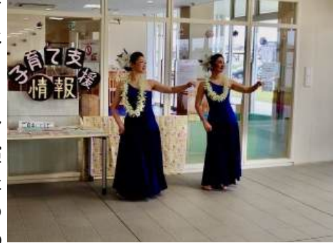
←悠紀サロンのようす

毎週練習を重ねながら、ボランティアとして市内のイベントに出演し、高齢者福祉施設などを訪問したりして踊ることで、地域の人々との交流を深めると共に、地域の方々の健康づくりを促し、地域社会に貢献する活動を行っています。