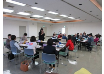
▲「ひとりじゃない社会をつくる支援のヒント」講座@なごみん

「誰かのために」と思って始めた市民活動が、続けるうちに疲弊してしまうことなく、話題の生成AIも活用して少しでもステップアップできるように企画しました。各研修の参加者アンケートでは、「受講してよかった」「活動に活かしたい」という高評価を多くいただきました。ご参加いただいた皆さま、ありがとうございました。