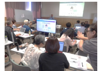
▲IT活用研修@悠紀の里 団体の運営効率化と情報発信の強化を目的に、AI(ChatGPT)とデザインツール(CANVA)を学ぶ全2回研修を実施しました。