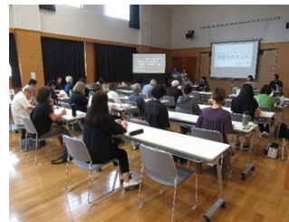
▲受援力のススメ@むらさきかん ボランティアを受け入れる「受援力」を高めるため、事例をもとに、つながりを生み出す配慮の仕方や活動のポイントを学びました。