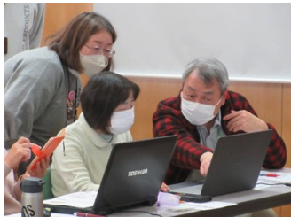
▲情報ひろば活用講座@よりなん 「おかさき市民活動情報ひろば」のサイトのログイン方法や写真投稿手順を解説し、サイトを活用した広報活動について学びました。

講演等を通じ、地域での孤立を防ぐ協働の方法を学び、団体運営と地域づくりに役立つ視点を得ました。