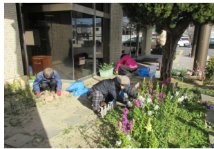
▲今年1月のお花のお手入れ