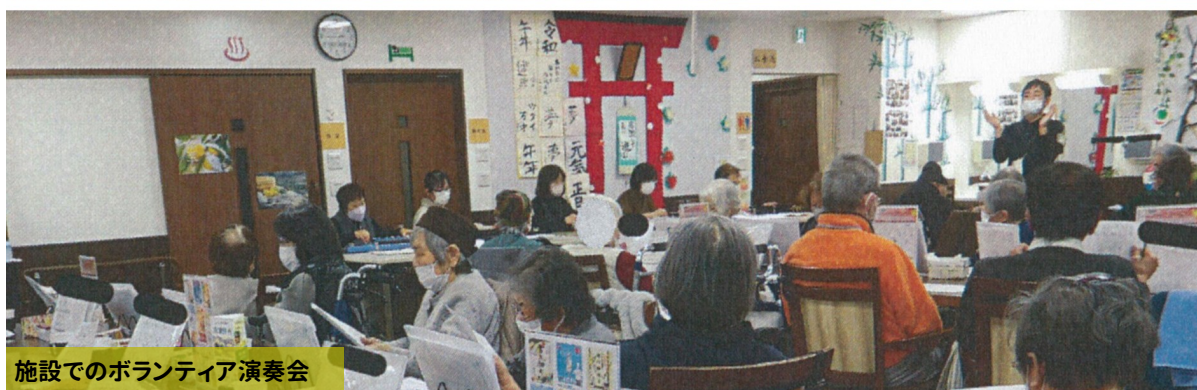
施設でのボランティア演奏会