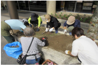
▲昨年10月の植え替え

6月上旬ごろ、なごみんガーデンの花の植え替えをします。お花が好きな方、土いじりが好きな方、未経験の方でも大丈夫です。ぜひご参加ください。