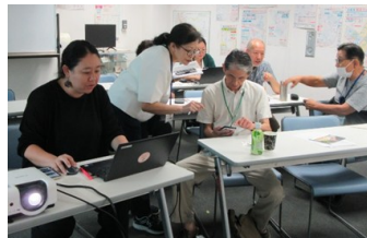
▲団体広報のために写真や動画を極めよう @やはざかん 写真や動画の撮影方法を実践的に学ぶことで、団体活性化や協働促進につながる発信力を高めました。