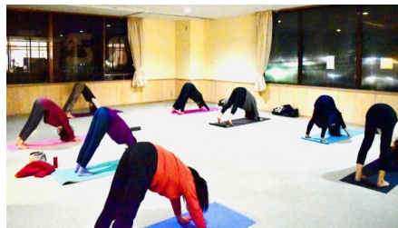
▲なごみんでのヨガ教室