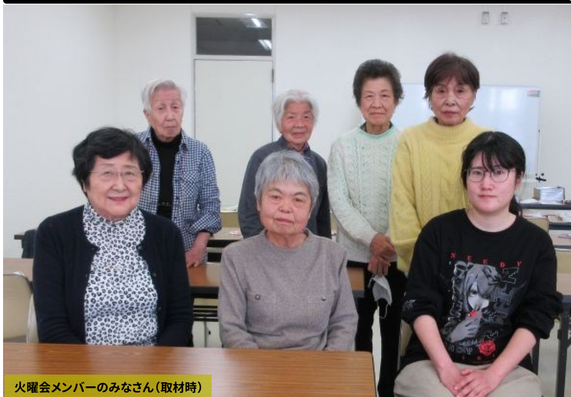
火曜会メンバーのみなさん(取材時)