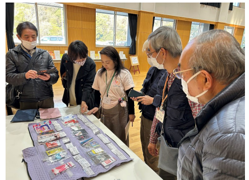
▲同時に開催した展示ブースで説明を受ける参加者

参加者アンケートでは、「『もしも』のために備える以上に、隣の人と日々笑って過ごす関係づくりこそが大切」など、地域コミュニティの重要性を再認識する前向きな感想が多数寄せられました。「犠牲者ゼロは地域力から」という言葉のとおり、日ごろのつながりが、いざという時に支え合う力につながることを実感する交流会となりました。