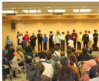
▲なごみんでのイベント

毎月2回の稽古では、劇の他にグループに分かれて即興劇ゲーム、歌の練習、リズム&楽器遊びなどを行っています。劇の稽古という形をとりながら、いろんな立場や状況の人との出会いの場の提供もしています。2年に1度行われるイベントや公演では、ステージの他に、市内の各種事業所を招いてマルシェも開催しています。