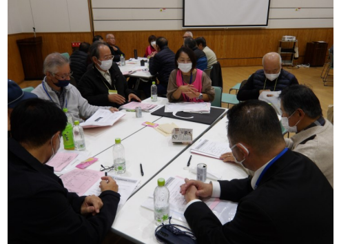
▲六ツ美4学区混合のグループ交流会 学区で楽しいイベントを企画できるように情報共有