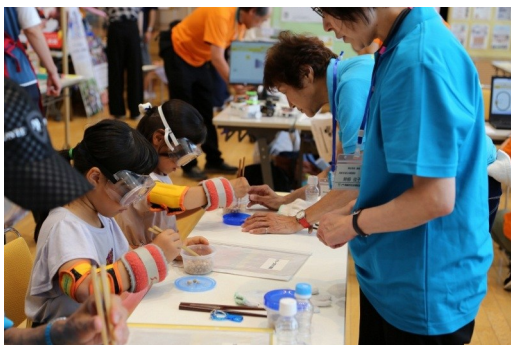
▲高齢者疑似体験中の子どもたち

7月26日(日)10:00~15:00に小学生を対象に、自由研究や夏休みの宿題を支援するイベントを、昨年よりパワーアップした内容で開催します。今回は自由研究のほか、学習支援や子ども博士・社会課題・ジュニアマルシェの各ブースを予定しています。子ども博士ブースは、自分の得意分野を自分の言葉で伝えます。また、ジュニアマルシェブースは自分が製作したものを販売します。子どもたちの想像力豊かな作品は、より一層興味を引くこと間違いなし!